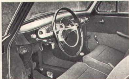
Так выглядит «рабочее место» водителя. Обратите внимание на штурвал и щиток приборов.