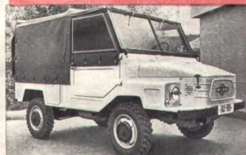
А это ЗАЗ-969 снаружи и внутри. Он предназначен для работы на селе.