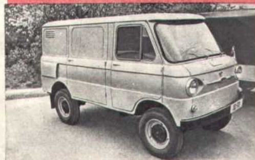
Такие фургоны связку десятки предприятий в каждом городе.